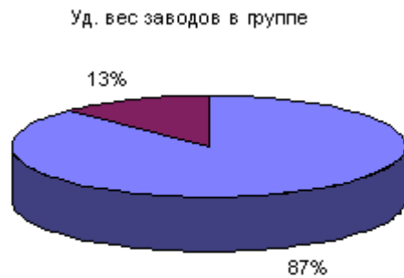
Рис. 1. Структура заводов по выполнению плана